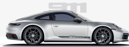
911 Carrera T